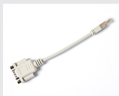
PA-SCA-001 RJ25 to DB9M 連接線