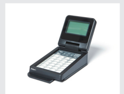
PA-TDU-003 觸控面板及螢幕(可供標籤機單機操作，僅限於PT-P950NW使用)