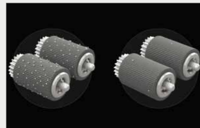
特殊橡膠滾輪材質，明顯減低灰塵沾染滾輪，影響列印。