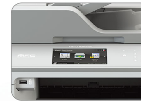
4.85" 中文彩色觸控螢幕