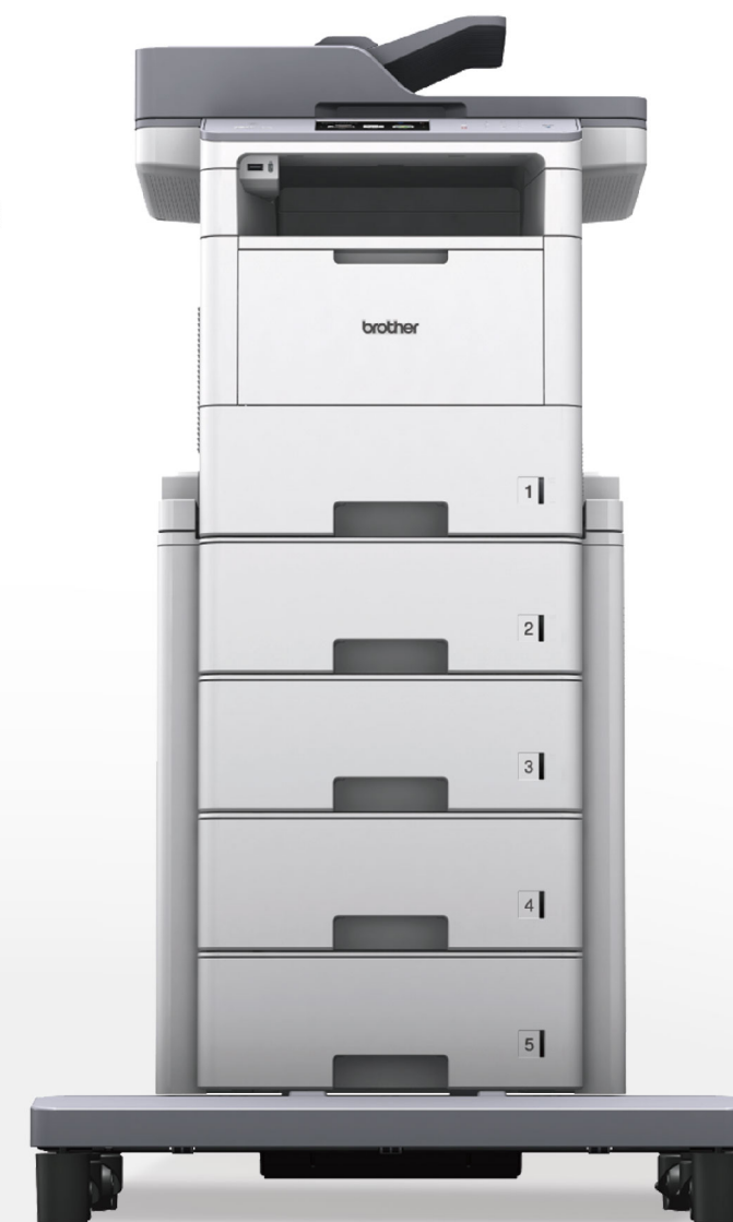
MFC - L6900DW_TT

台灣兄弟國際行銷股份有限公司 Brother International Taiwan Ltd. 台北市中正區忠孝西路一段66號33樓 免付費客服專線：0800-600-211 www.brother.tw