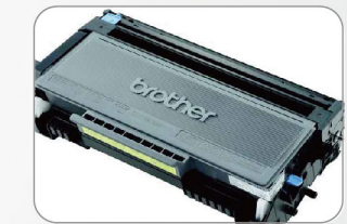
可列印達20,000張的特級海量碳粉匣