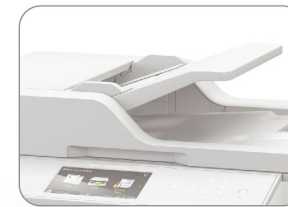
雙面 CIS 自動送紙器