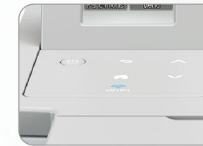
簡單好用的控制面板