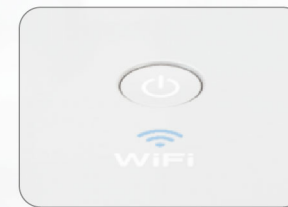
無線及GB級乙太網路連接