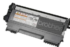
TN-3478 可列印達 12,000 張 的超高容量碳粉匣