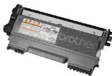
TN-3448 可列印達 8,000 張 的高容量碳粉匣