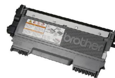
DR-3455 壽命達 50,000 張紙 的感光鼓 *