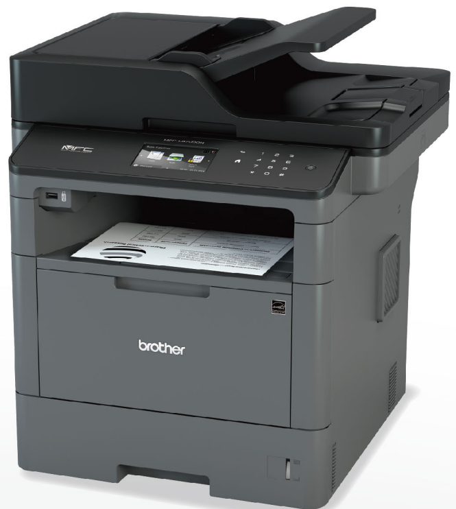
MFC - L5700DN