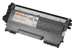
TN-3428 可列印達 3,000 張 的標準容量碳粉匣